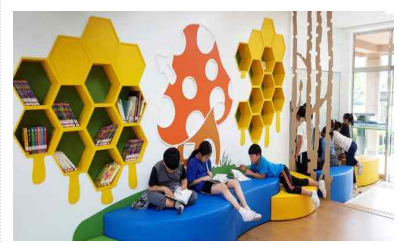
[휴식-학습 연계 공간]